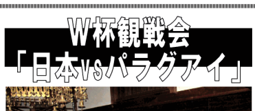
W杯観戦会「日本vsパラグアイ」

試合開始前には中京テレビの取材班の撮影も始まるので、会場のボルテージが上がります。試合中は、会場が一体となって観戦することができ、悲鳴が、危殆を脱したときは安堵の拍手がおこりました。